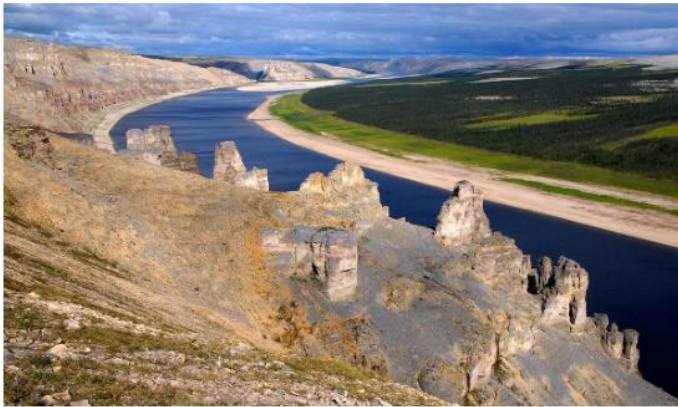
река Оленек

В текущем году организация планирует завершить геологоразведку, а в следующем — подтвердить запасы участков Беенчиме и Хатыстах.